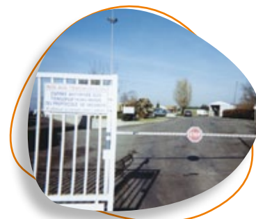
Entrée d'une entreprise industrielle