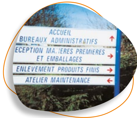
Panneau indiquant l'accueil et les zones d'enlèvement et de réception des produits PHOTO COLIBRI - 17800 PONS