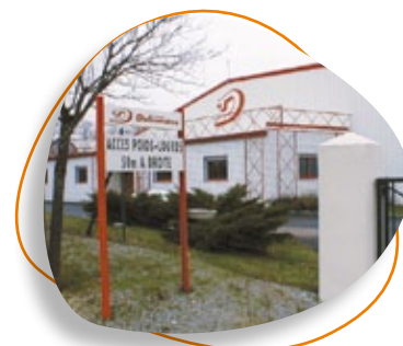
Panneau indiquant l'entrée des poids lourds et le nom de l'entreprise PHOTO TRANSPORTS DE LAUMÉDIE - 87430 VERNEUIL/VIENNE