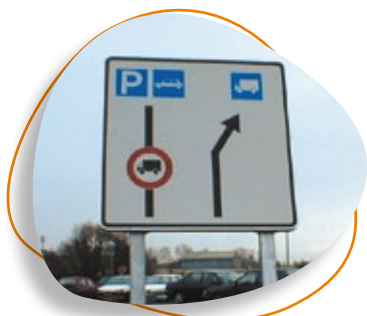
Panneau indiquant la voie à suivre par les poids lourds