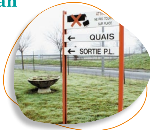
Panneau d'identification dans une entreprise PHOTO TRANSPORTS DE LAUMÉDIE - 87430 VERNEUIL/VIENNE