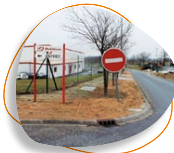
Panneau d'interdiction et panneau d'indication de l'entrée de l'établissement

Réalisation, impression Carsat Centre Ouest Édition / 2012